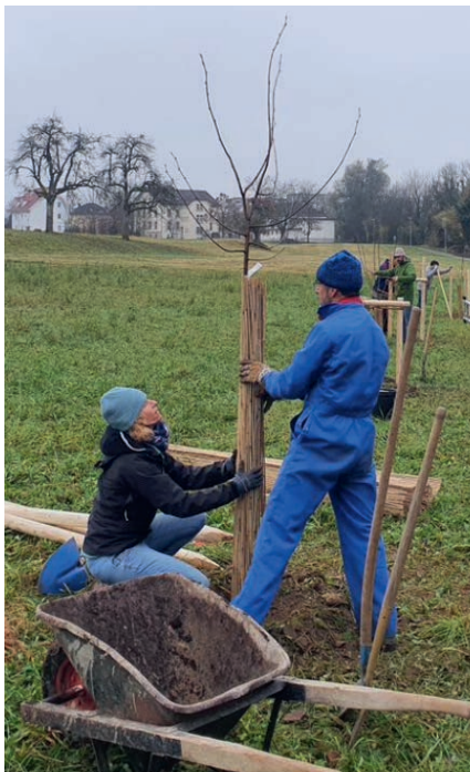
Neue Bäume entlang der Suhre.

Am 20. November 2021 war Pflanztag auf dem «Garten der Vielfalt». Zahlreiche Helfer haben an diesem grauen, aber trockenen Novembertag mitgeholfen, jungen Hochstamm-bäumen entlang der Suhre und kleinen Wildsträuchern auf der gegenüberliegenden Seite ein neues «zu Hause» zu geben. Neben dem Schulgarten, der natürlich bestehen bleibt, wurde eine Naschhecke gepflanzt, die als kleine Zwischenverpflegung für Schüler und Spaziergänger gedacht ist.