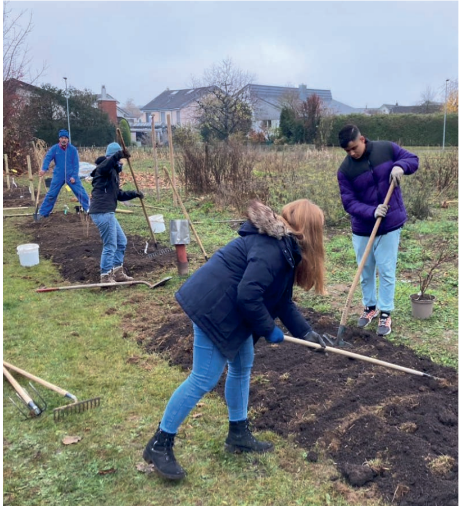
Viele Helfer bereiten die Erde für die Bepflanzung vor.

Das jüngste Projekt des NVV ist der «Garten der Vielfalt», ein Begegnungsort für Mensch und Natur, der südlich des Schulhauses Suhrenmatte am Entstehen ist. Mit gezielten Aktionen soll eine Lebensgrundlage für zahlreiche Tiere und Pflanzen geschaffen werden. Spaziergänger und Schüler können so eine grössere Vielfalt an Insekten und Vögeln beobachten, sich über mehr blühende Pflanzen erfreuen oder von den Beeren der Naschhecke probieren. Die erste Massnahme war, dass im Frühsommer Samen für eine Wildblumenwiese ausgesät wurden. Das Saatgut, das vom Lieferanten in Wiesen des Mittellandes gesammelt wurde, konnte nur teilweise maschinell ausgebracht werden. So traf sich der NVV-Vorstand spontan an einem Abend anfangs Juni, um Landwirt Gysi beim Säen von Hand zu unterstützen.