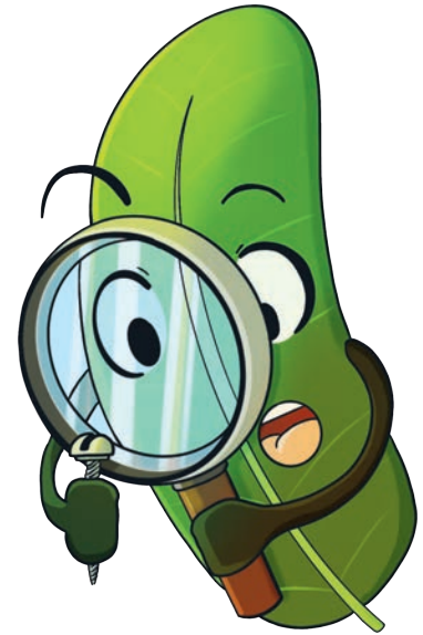
Das Maskottchen Buxli.

Natürlich wird zu passender Zeit auch eine Webseite aufgeschaltet werden, auf der alle Informationen noch einmal gesammelt zur Verfügung gestellt und auf der die Teilnahmemöglichkeiten, sowie die Lösungshilfen zu finden sein werden. Denn auch wenn man einmal nicht mehr weiter weiss, heisst dies nicht,