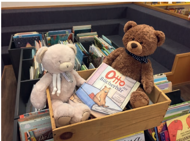
Otto, der Bücherbär.

Laufend entwickelt das Bibliotheksteam neue Formate wie zum Beispiel «Tierisch gut!», «Leseratte Paula», «Halt die Klappe», «Escape the Library» usw. Das Projekt «Büchereinkauf» ist bei den Lehrpersonen und ihren Klassen dermassen beliebt, dass ein Herbst- und ein Frühlingseinkauf durchgeführt werden mussten. So kamen alle Sechstklässler in den Genuss dieses Angebotes. «Die Kinder haben sich riesig gefreut. Selber ein