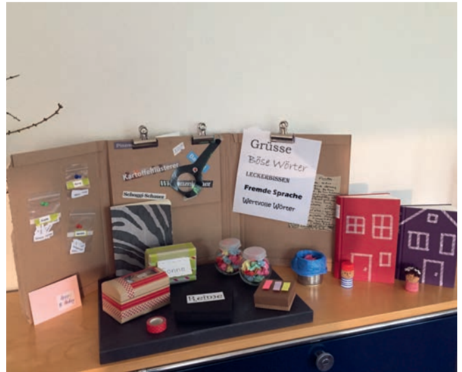
Die grosse Wörterfabrik.

Jährlich führt die Bibliothek rund 20 Kinderveranstaltungen durch. In den vergangenen zwei Jahren mussten diese wegen der Pandemie leider häufig abgesagt werden. Da eine Durchmischung der Klassen untersagt war, setzte die Bibliothek den Schwerpunkt auf Veranstaltungen mit einzelnen Klassen. Die verschiedenen Workshops sollen Leselust wecken und ganz nebenbei werden Sprach-, Lese-, Medien- und Recherche-kompetenzen gefördert. Die Erfahrungen sind überaus positiv und die 41 Buchungen im letzten Jahr ein voller Erfolg.