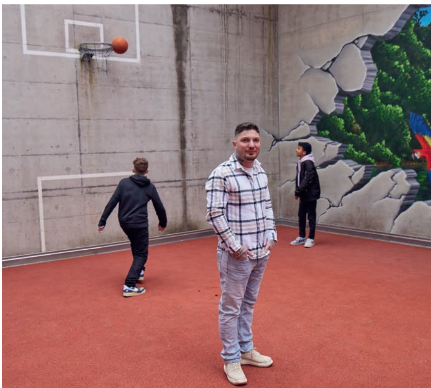
Die Jugendlichen spielen Basketball im Aussenbereich der Strafanstalt.