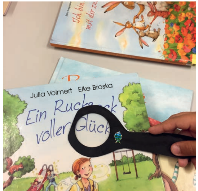
Wertvolle Wörter suchen.