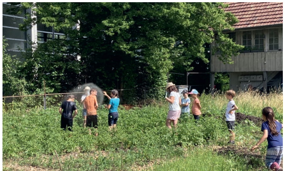
Die Kartoffeln müssen gegessen werden und die Gärtnerinnen und Gärtner geniessen die Abkühlung.

Das «Gartenkind» ist ein Projekt, das von Bioterra ins Leben gerufen wurde. Neben dem Buchser Standort gibt es noch ca. 60 weitere Standorte in der Schweiz. Auf spielerische Art und Weise entwickeln die Kinder im Garten ein Verständnis für die Biodiversität, die Zusammenhänge der Natur und was es braucht, um gesunde Lebensmittel herzustellen. Die 1.–5. Klässler auf dem «Gysimätteli» konnten unter anderem beobachten, wie die Natur Kreisläufe schliesst. Wir haben Pflanzen stehen oder Salate schiessen lassen, auch wenn sie verblüht waren, um einerseits Saatgut zu sammeln und andererseits den Insekten und Vögeln Nahrung und Lebensräume für den Winter zur Verfügung zu stellen. Die Beikräuter werden nur beim Gemüse gejätet oder wenn sie am Blühen sind, damit der